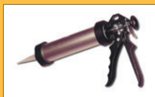
Montážní lepidlo MEGA FIX (interiér)