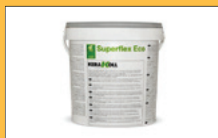
Montážní lepidlo SuperFlex Eco (exteriér)