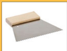
Ozubená stěrka s výškou hřebene 6 mm