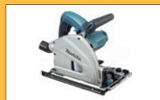
Kotoučová pila nebo úhlová bruska